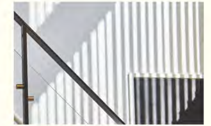
自然光きらめくハイサイドライト

入った瞬間に全体を見回せる開放的なリビング空間は、常に家族の存在を感じることができます。また天井の高い吹き抜け構造となっており、窮屈のない伸びやかな居心地も平屋ならではの、自然と調和する内装もあいまって、他にはない安らぎを得られることでしょう。