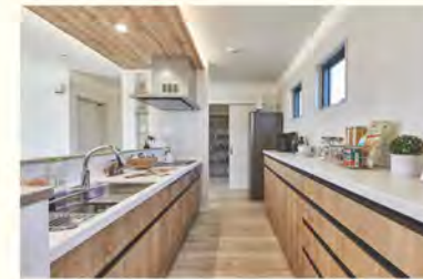
家事動線を徹底研究

自然との触れ合いが知的好奇心やコミュニケーション力を育むことは知られています。そして、自然と一体となった家づくりが、FAVO for HIRAYAの魅力のひとつです。本プランは、自然と調和する内装を採用し、中庭にシームレスにつながる空間設計を実現。常に自然を感じることができます。