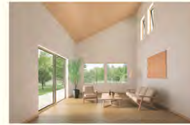
自然と調和したしつらえ

シンプルで無駄のない空間は、現代のミニマルなライフスタイルにふさわしいもの。一方で、自然と調和する内装や中庭、縁側などの要素が、一般的な住まいには見られない“暮らしの艶”を演出します。合理的でありながら情緒豊かな空間は、FAVO for HIRAYAならではの魅力です。