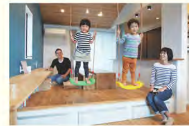
長年の知見を活かした“キッズデザイン”

外壁の南北面に設けられた高位置の格子とハイサイドライト。これらは明るい空間をつくるだけでなく、季節や時間によってさまざまな光の変化や陰影を生み出し、自然がおりなす美を楽しむことができます。