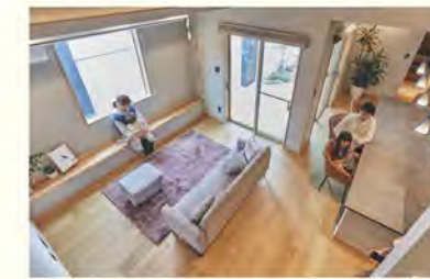
いつでも、目の届くところに

アイフルホームの家づくりの基本は「子ども目線・子ども基準」。日々、安心して子育てができる環境づくりを追求しています。「安全性」や「遊び」、「成長」などの視点から、さまざまなキッズデザインが取り入れられています。