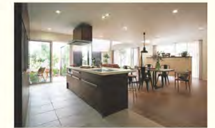
高性能なLIXIL製品が標準仕様

生活動線のさまざまなポイントに収納スペースを設えることで、行動に合わせて必要なものを整理することができます。本プランでは、各部屋はもちろん玄関土間収納やパントリー収納、大容量のリビング収納スペースを設置。必要な収納をデザインの一部として適所にあしらうことで、平屋空間を快適に維持できます。