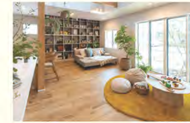
開放的な空間に安らぐ

シンプルで無駄のない空間は、現代のミニマルなライフスタイルにふさわしいもの。一方で、自然と調和する内装や中庭、縁側などの要素が、一般的な住まいには見られない“暮らしの艶”を演出します。合理的でありながら情緒豊かな空間は、FAVO for HIRAYAならではの魅力です。