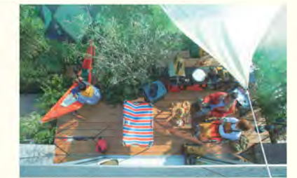
身近な自然が感性を育む

広く取られたリビングでは、いつでも子どもの様子を伺うことができます。パパやママとの距離が近いことで子どもにも安心感を与え、家族間のコミュニケーションも促進します。リビング脇には子ども部屋もあり、成長に応じた使い方が可能です。